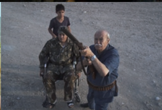
Dakar trottoirs - Le Veau d'or - J'ai cinquante ans