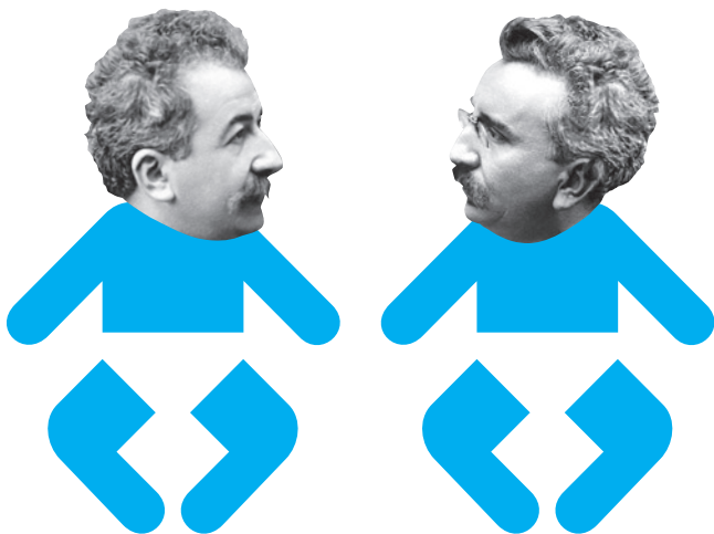
LOUIS JEAN LUMIÈRE, NÉ À BESANÇON