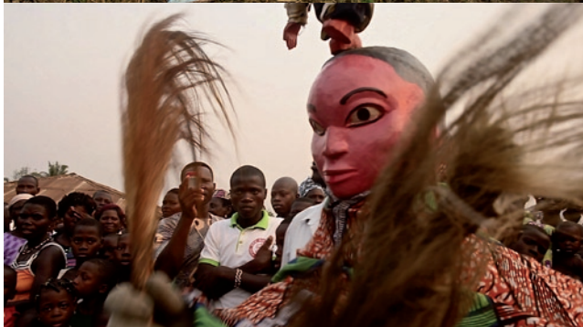
Picci Toubab, l'oiseau des blancs - Le Secret des Iyas