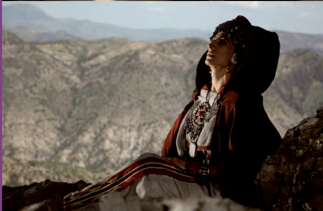
Lalla Fadhma N'Soumer