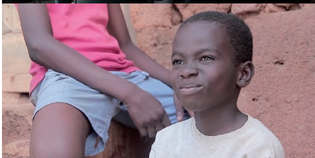
Frontières - Lidao - Kwaku