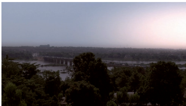
Barakeden, les petites bonnes de Bamako

■ Meissonier, Alger centre, sur la placette en face du cinéma fraîchement rénové Sierra Maestra, le cinéaste se mêle aux gens du quartier pour parler avec eux de cinéma. Attentif à ce qu'ils peuvent lui raconter de leur vécu, il se laisse très vite porter par les rencontres spontanées et les situations improvisées. Le film dresse un portrait vivant de la ville et propose en filigrane une réflexion sur la place du cinéma en Algérie.