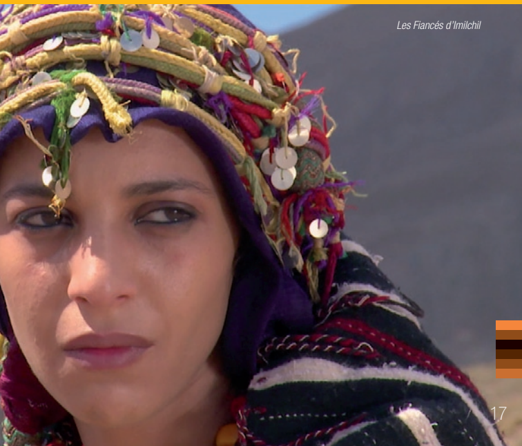
Les Fiancés d'Imilchil