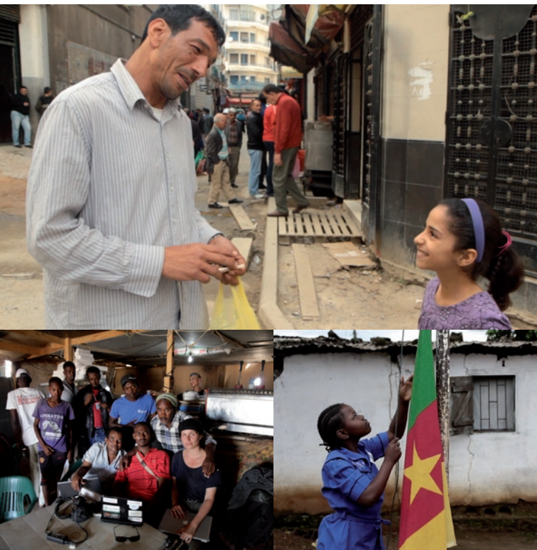
Bla Cinema - Choucha - Du Piment sur les lèvres