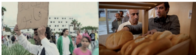
Houkak - La Maison mauve