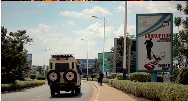
La Forêt sacrée - Rwanda, du chaos au miracle