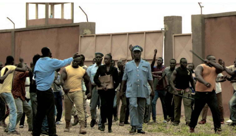
L'Œil du cyclone